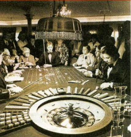
So wurde früher in der Spielbank am Roulette-Tisch gezockt: feine Anzüge, konzentrierter Blick

hier ausleihen kann. Früher ging ohne Anzug und Krawatte nichts.“ Trotzdem liebt er unsere Spielbank, besucht in seiner Freizeit sogar andere Casinos, aber nur zum Gucken. Nur selbst gespielt hat der Vater von drei Kindern noch nie. Sein Glück ist seine Familie!